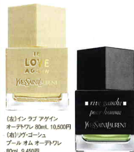
(左)インラブアゲイン オードトワレ 80ml 10,500円 (右)リヴゴージュ プール オム オードトワレ 80ml 9,450円