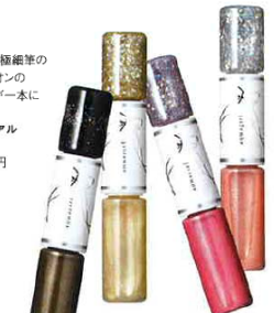
ベースカラーとアートカラーがセットになった手軽におしゃれが楽しめるネイル。 カップリングネイルラッカー 全14色 各2,310円