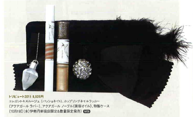
トリビュート2011 8,925円 エレガントキスルージュ (バッションネット)、カップリングネイルラッカー (アクアガールラバー)、アクアガール ノール (美容オイル)、特製ケース (10月19日(水)伊勢丹新宿店限定&数量限定発売) WEB

セレクトショップ『アクアガール』でしか手に入らなかったメイクアップアイテムと、伊勢丹新宿店だけのコフレを発売。コフレには「エレガントキスルージュ」のバッションネットと、ベースカラーとアートカラーがセットになって1本でアレンジが自在な「カップリングネイルラッカー」のアクアガールラバー、さらにこのコフレだけの香りつき美容オイルを豪華な特製ケースに詰めて。