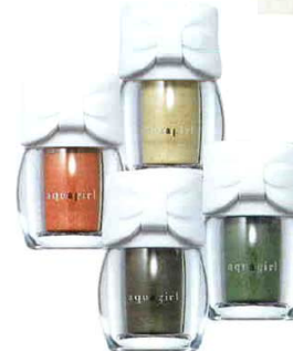
目元、口元、チークにも自由自在にオン! ふんわり明るく見せるグラマラスメイク配合のマルチカラーパウダー。 カラーランゲージ 全35色 各2,928円