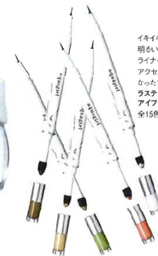
イキイキとした明るい瞳を演出。超細筆のライナーとチップオンのアクセントカラーが一本になったアイカラー。 ラスティングデュアルアイフィックス 全15色 各2,940円