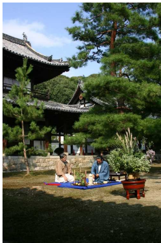
萬福寺の野点(京都府)